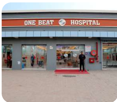
ONE BEAT CHARITABLE EYE HOSPITAL वन बीट चैरिटेबल आँखों का अस्पताल

CHAMKAUR SAHIB, PUNJAB चमकौर साहिब, पंजाब