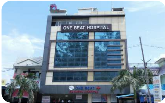
ONE BEAT DASHMESH CHARITABLE HOSPITAL वन बीट दशमेश चैरिटेबल अस्पताल

BHIRA - KHERI, UTTAR PRADESH भीरा - खीरी, उत्तर प्रदेश