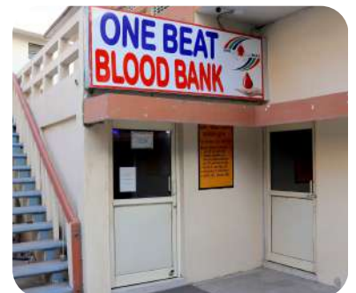
ONE BEAT BLOOD BANK वन बीट रक्त बैंक

MEHANGAPUR, UTTAR PRADESH मेहंगापुर, उत्तर प्रदेश