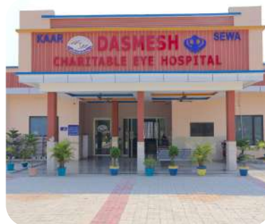
DASHMESH CHARITABLE EYE HOSPITAL दशमेश चैरिटेबल आँखों का अस्पताल

BHIRA - KHERI, UTTAR PRADESH भीरा - खीरी, उत्तर प्रदेश